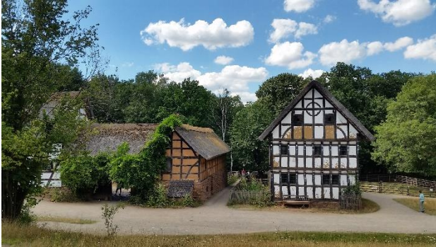
Kommern Freilicht Museum

Danke, dass ihr für meinen Sommerurlaub gebetet habt. 😊 Ich habe 12 Tage in einem last-minute B&B beim Harkortsee in der Nähe von Düsseldorf verbracht. Ich bin spazieren gegangen, habe genäht und ... jede Menge Renovierungsprojekte auf HGTV geschaut. Mit einer Freundin war ich 2 Wochen in Mechernich in der Eifel anstatt in Nordirland.