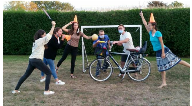
Willkommen... Sport alternative

sie auf das Ergebnis des Covid Tests warten musste. Wir hatten seit Beginn der Schule eine Reihe von Tests durchführen lassen- sie waren alle negativ!